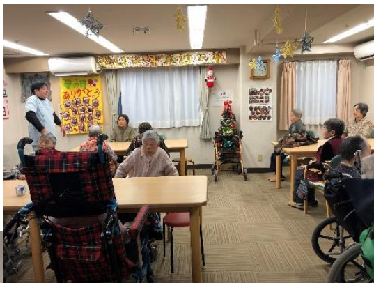
リハビリの先生と リビングにて