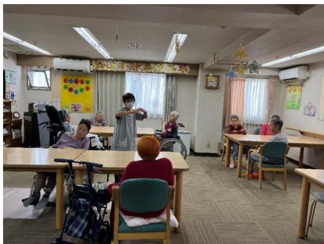
スタッフによる レクリエーション